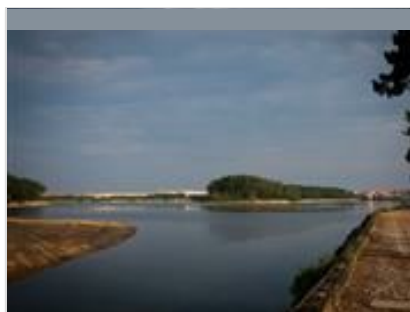
Lac marin de Port d'Albret