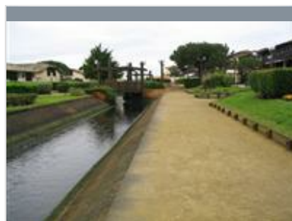
A Vieux Boucau, circuit du Lac Marin